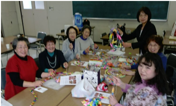
仙台3クラブメネット会

各地のメネットの皆さんから届けられた折鶴で、大会で飾る平和七夕の製作が進んでいます。 (2019.3.23 撮影)